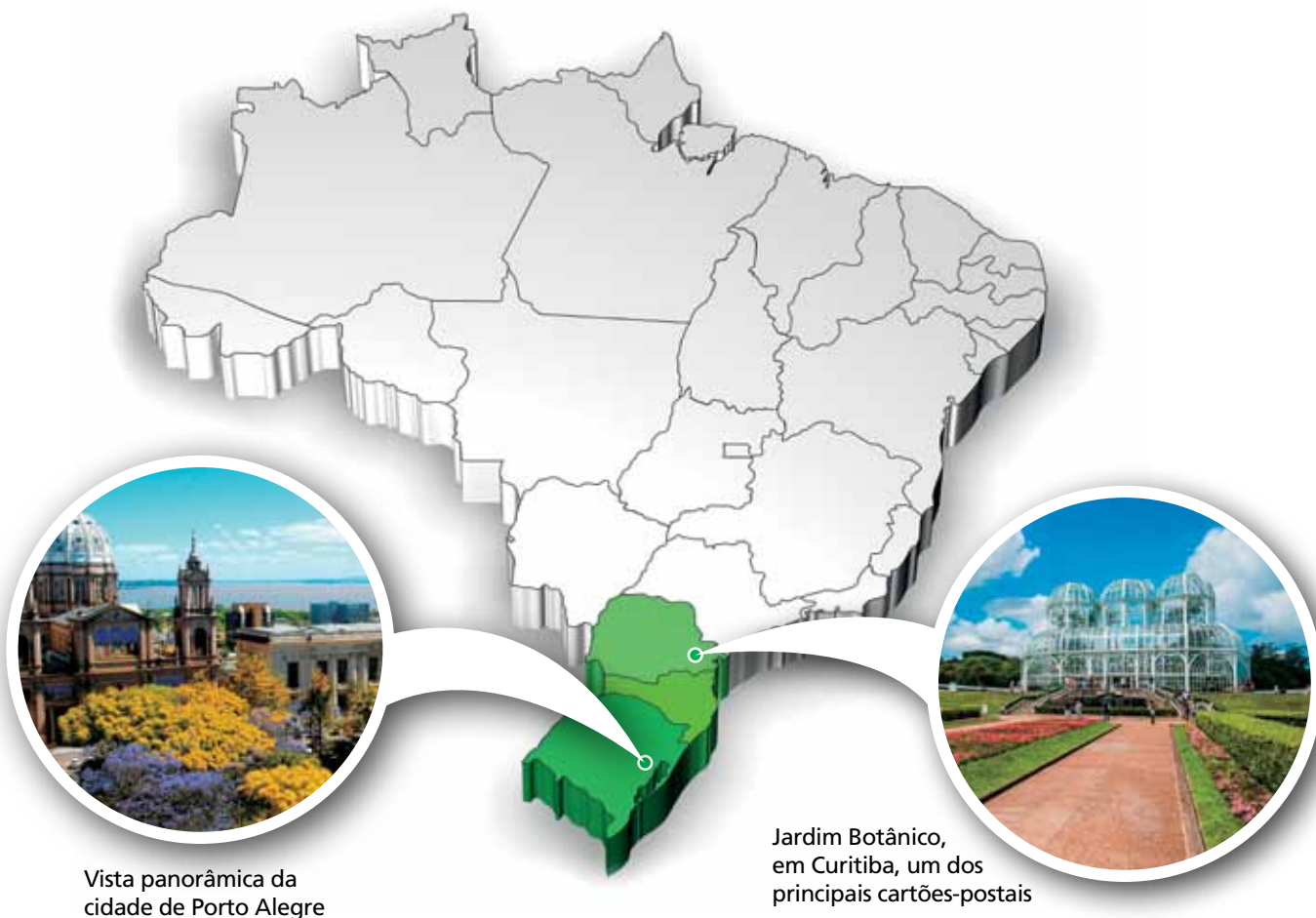
Vista panorâmica da cidade de Porto Alegre

As duas cidades-sede do Sul do país, Porto Alegre e Curitiba, concentram apenas 5,46% do orçamento da Copa do Mundo, que oficialmente é de R$ 25,36 bilhões em todo o país, conforme observa a consultoria Delta Economics & Finance. Nas duas cidades, os investimentos preponderantes são com os estádios. O Beira-Rio, em Porto Alegre, consumiu R$ 330 milhões, e a Arena da Baixada, em Curitiba, foi orçada em R$ 326,7 milhões. São dois investimentos com retorno garantido. Afinal, Internacional e Atlético Paranaense, donos dos respectivos estádios, são times da primeira divisão do futebol brasileiro e que mobilizam grandes torcidas em seus jogos. As obras em aeroportos e mobilidade urbana nas duas cidades, repetindo praticamente o que ocorreu em todas as cidades-sede, porém, não estão concluídas em sua totalidade e muitas foram adiadas para depois da Copa.