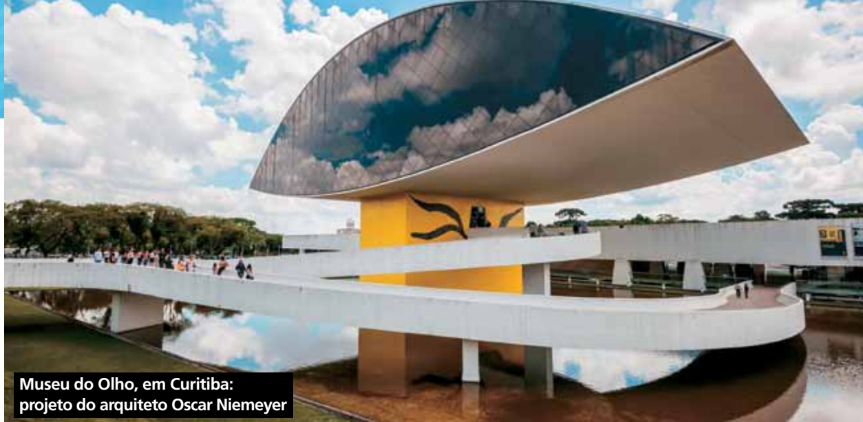
Museu do Olho, em Curitiba: projeto do arquiteto Oscar Niemeyer